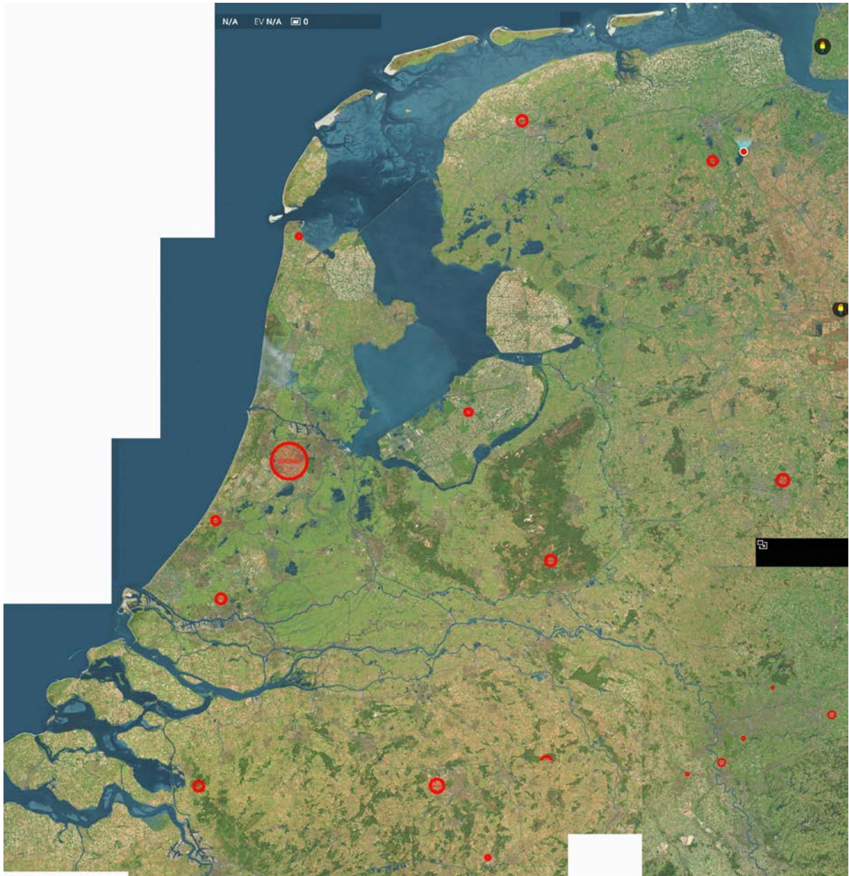
Bijlage 1 (netjes buiten de cirkeltjes blijven anders grijpt de fabriek in!)