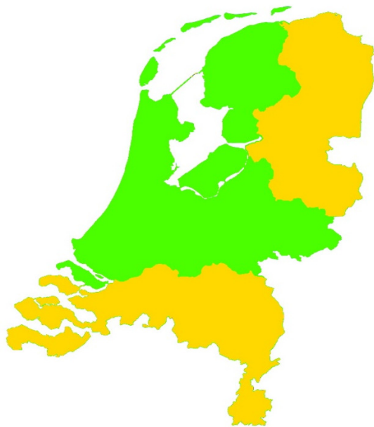
Figuur 1: verzorgingsgebied Utility Connect (groen)

Figuur 1 toont het deel van Nederland waar de klanten van Utility Connect momenteel diensten afnemen.