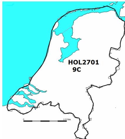
Figuur 2: Frequentieblok 9C.

Het landelijke frequentieblok 9C heeft de omtrek als beschreven in figuur 2.