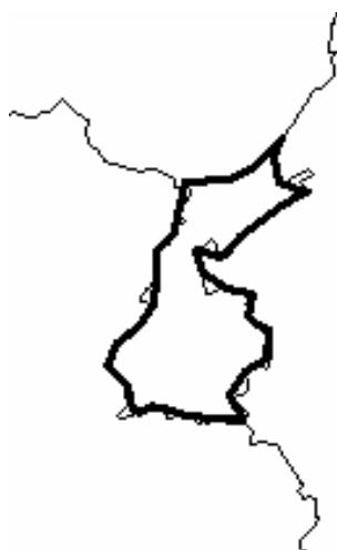
Figuur 3: Gemarkeerd gebied van (mogelijke) inzet van frequentieblok 5A, 7B of

Het frequentieblok 5A, 7B of 8C in Limburg-Zuid heeft de omtrek als beschreven in figuur 3.