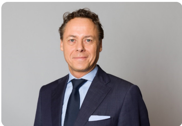
Ralph Hamers CEO ING Group

A fundamental shift in customer expectations means the European economy is increasingly driven by data-created value. The regulatory framework for personal data is fundamentally shaped by the EU. It seeks to walk the fine line between privacy protection and fostering data sharing.